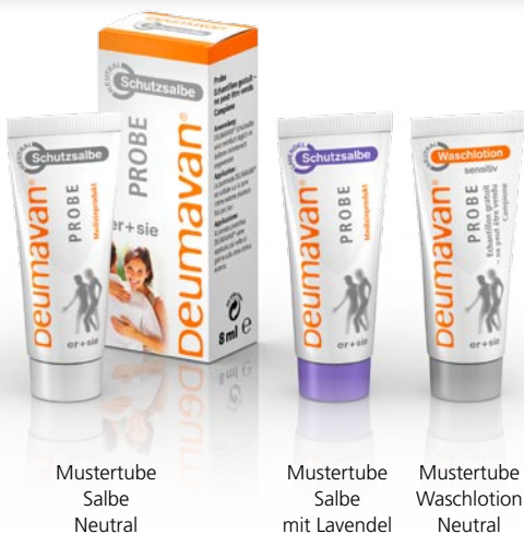
Mustertube Salbe Neutral