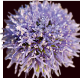
Die pflanzlichen Stammzellen der Kugelblume

stimulieren die Entgiftung der Zellen und die Zellregeneration.