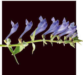
Das Helmkraut vom Baikal

regt den Zellstoffwechsel an und steigert das Volumen der Haarwurzel.